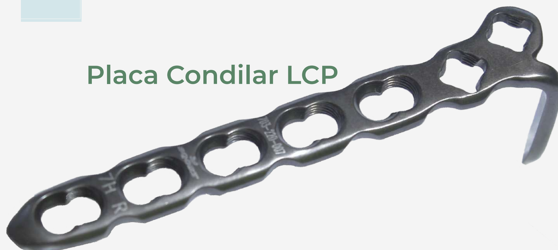
Placa Condilar LCP