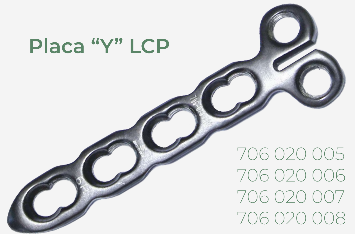
Placa "Y" LCP

706 020 005 706 020 006 706 020 007 706 020 008