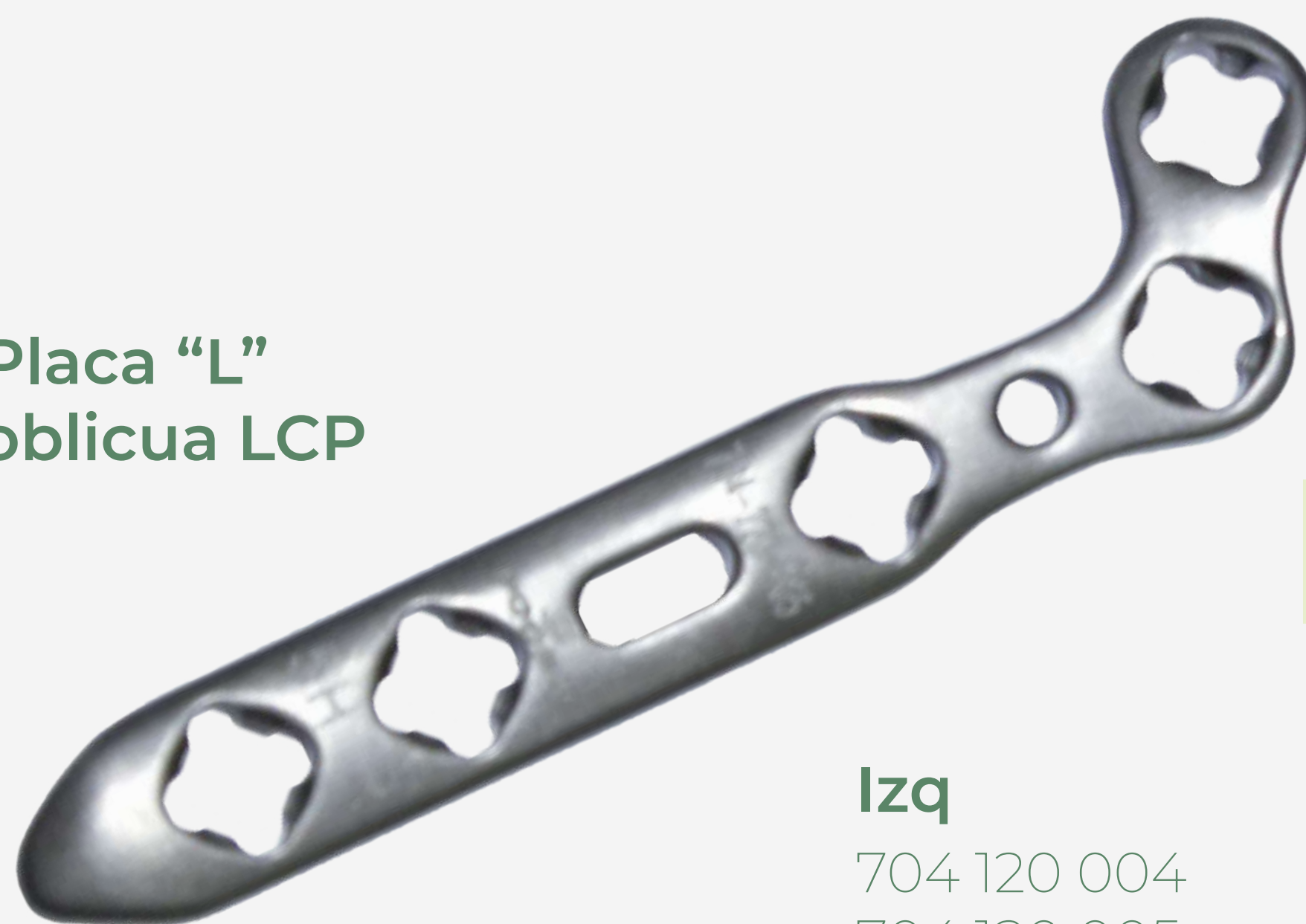
Placa "L" oblicua LCP