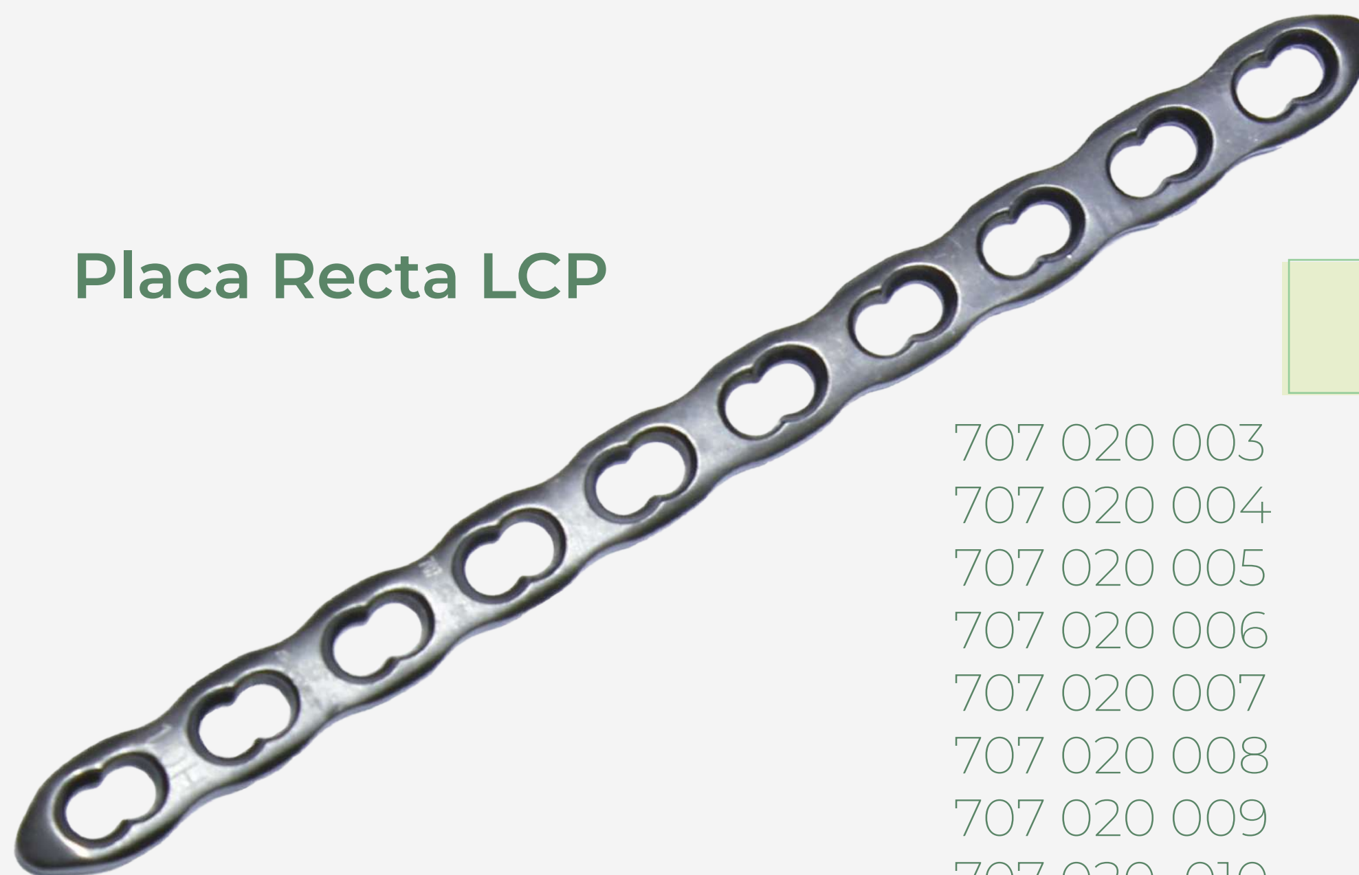
Placa Recta LCP

707 020 003 707 020 004 707 020 005 707 020 006 707 020 007 707 020 008 707 020 009 707 020 010