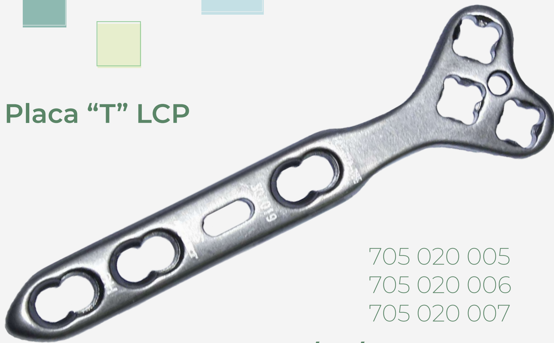
Placa "T" LCP