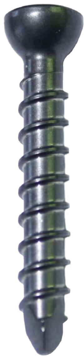
Perno de Bloqueo PFNA