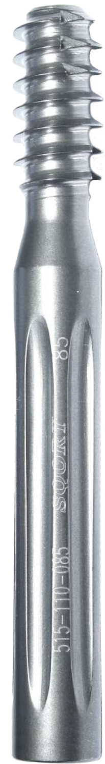
Perno de Bloqueo Cuello Lag PFNA

515 010 075 / 080 / 085 / 090 / 095 / 100 / 105 / 110 / 115 / 120