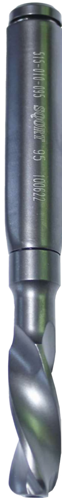
Perno de Bloqueo Cuello Helice PFNA

515 050 030 / 032 / 034 / 036 / 038 / 040 / 042 / 044 / 046 / 048 / 050 / 052 / 054 / 056 / 058 / 060 / 065 / 070 / 075 / 080 / 085 / 090