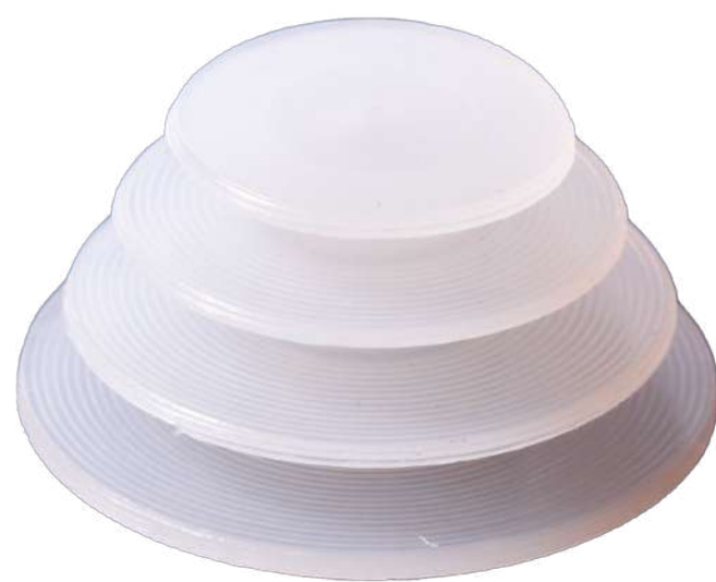
Restrictor de cemento